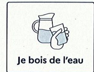
Je bois de l'eau