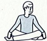
Je fais des activités sans effort