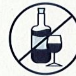
J'évite de boire de l'alcool