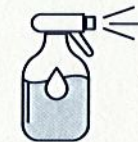
Je mouille mon corps