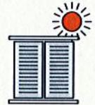
Je ferme les volets et fenêtres le jour, j'aère la nuit