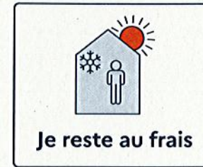
Je reste au frais