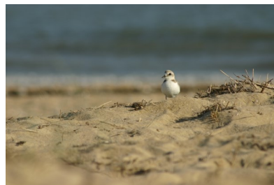
Gravelot à collier interrompu, oiseau nicheur sur les plages de la Pointe de l'Aiguillon

Depuis août dernier, l'équipe de la réserve s'est agrandie avec la création d'un poste de Chargée de mission Education à l'environnement, permettant de développer l'animation sur et autour de la réserve. Au cours de l'année, des sorties « La Baie au fil des saisons » sont proposées gratuitement, où vous découvrirez quasiment chaque mois un site différent, accompagnés de l'animatrice et équipés de matériel d'observation. Les dates sont disponibles sur le site www.lpo.fr .