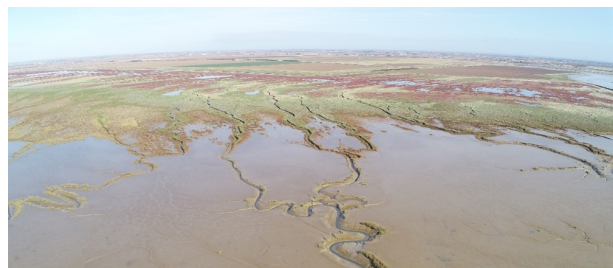
Vue aérienne sur les prés salés et la vasière